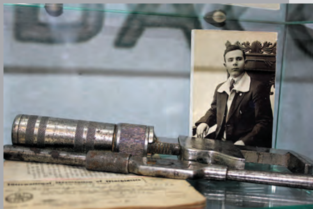
Вещи колонистов — людей, которые приезжали в наш край с разных концов света, — помогают окунуться в атмосферу прошлых лет и представить, как жили и трудились, какие сложности преодолевали люди того времени