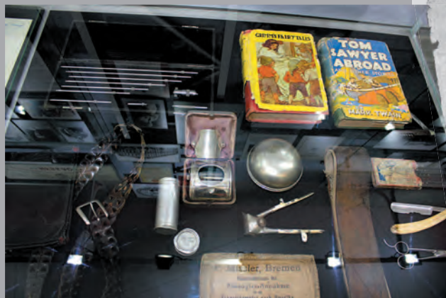
Орудия труда и предметы быта собраны в единую коллекцию в том числе при участии потомков колонистов и жителей Кемерово