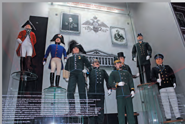
Формы инженеров горного ведомства выполнены скрупулезно и точно. Роли личности в истории Кузбасса на экспозиции уделено большое значение